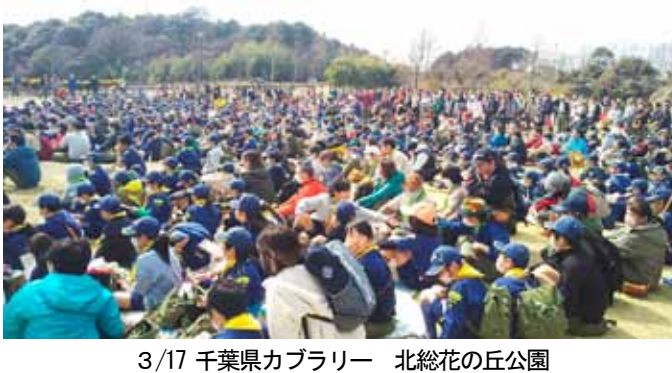
3/17 千葉県カブラリー 北総花の丘公園